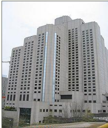
バンクーバー総合病院