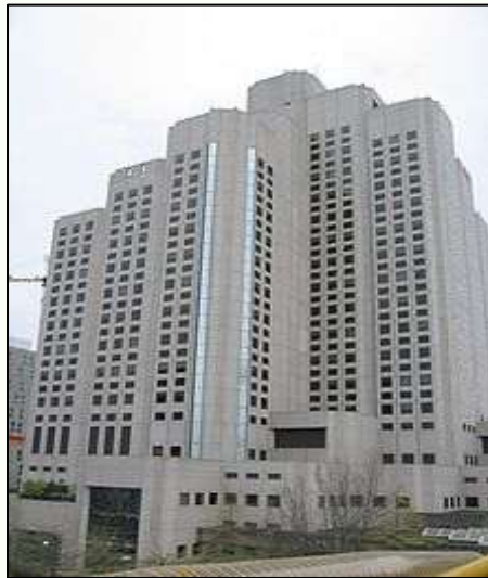
バンクーバー総合病院